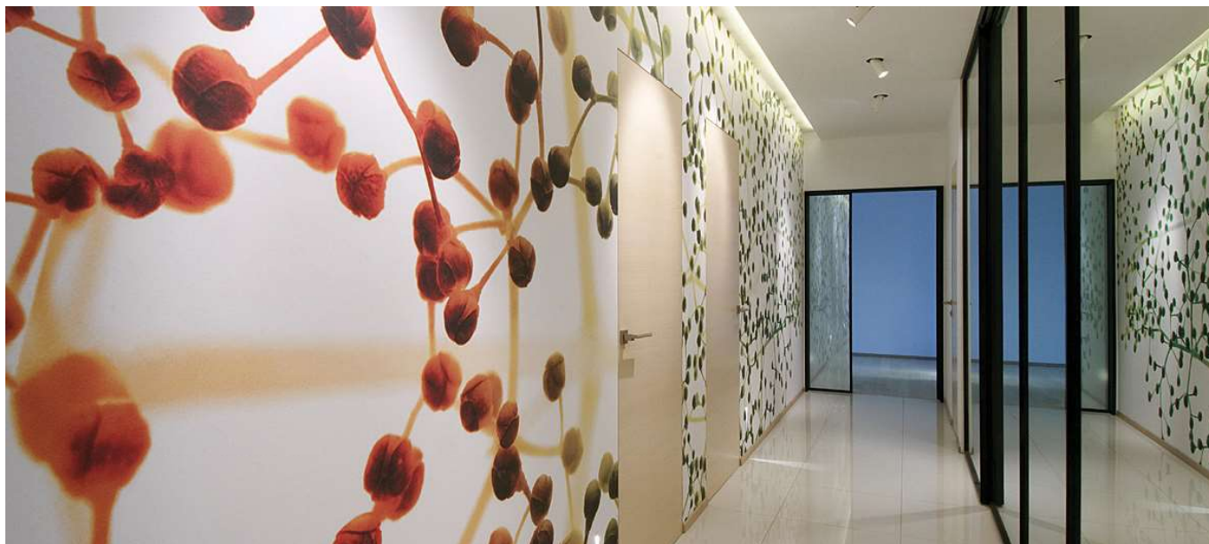
Byt na Ulici F. Kráľa v Bratislave, 2015