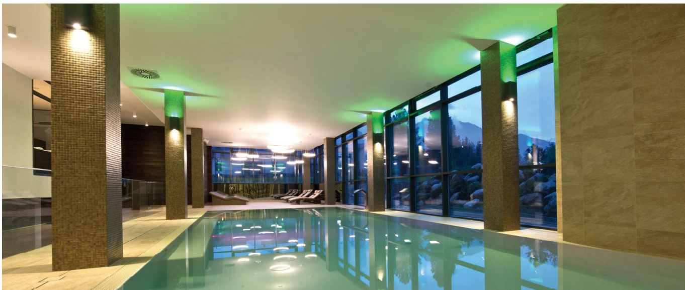
Wellness v hoteli Lesná, Stará Lesná, 2015