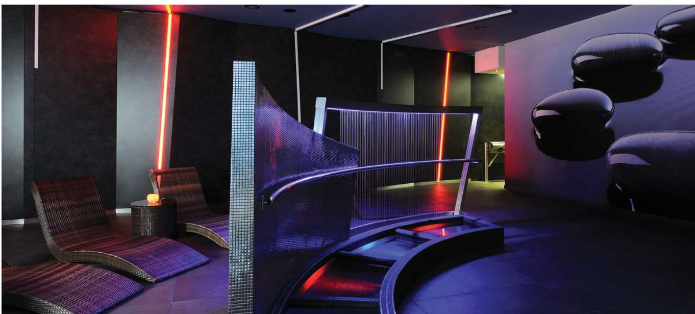
Wellness Cassovar v Košiciach, 2010