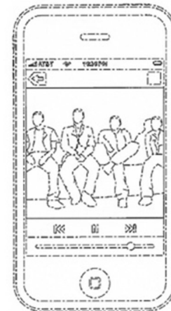
Príklad animovaného grafického používateľského rozhrania pri zapísanom dizajne Spoločenstva č. 846977-0004

S cieľom zvýšiť právnu istotu spomenutá pripravovaná novelizácia vymedzenia pojmu „dizajn“ na európskej úrovni navrhuje rozšíriť výpočet jednotlivých znakov tak, že dizajn môže vyplývať aj z „pohybu, prechodu alebo akéhokoľvek iného druhu animácie týchto znakov“. 79 Táto zmena sa má tiež dotknúť vymedzenia pojmu „výrobok“, 80 spôsobu vyjadrenia samotného dizajnu pri zápise dizajnu do registra 81 a práv vyplývajúcich z práva k dizajnu. 82