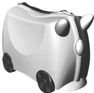
Príklad vyjadrenia farebných vzťahov v čiernobielym vyobrazení pri zapísanom dizajne Spoločenstva č. 43427-0001

Aj v prípade čiernobieleho prevedenia môže dôjsť k situácii, kedy vyobrazenie môže vyjadrovať farebný vzťah medzi jednotlivými časťami výrobku, napr. rozlišovanie medzi tmavším a svetlejším sfarbením alebo farebný kontrast medzi jednotlivými časťami výrobku, ktoré môžu ovplyvniť rozsah poskytnutej ochrany. 38