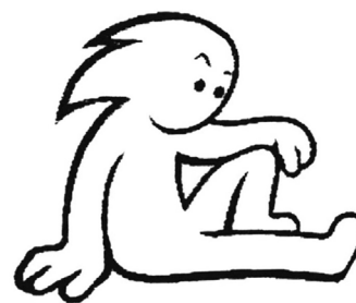
Príklad zdobenia pre reklamné materiály pri zapísanom dizajne Spoločenstva č. 426895-0002 52

Posledným znakom v ich výpočte pri definícii pojmu „dizajn“ je zdobenie. Podobne ako pri niektorých z uvedených znakov sa zdá byť zdobenie trochu nadbytočné, pretože môže byť vyjadrené prostredníctvom línií a farieb pri plošných vzoroch. Hoci zdobenie môže byť tiež trojrozmerné a bez viazania na konkrétne farby, aj v takom prípade je ho možné vyjadriť prostredníctvom obrysov a tvarov.