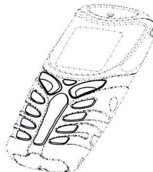
Príklad použitia viacerých druhov čiar pri zapísanom dizajne Spoločenstva č. 30606-0003

objektov ide o náčrt ich dizajnu z rôznych strán pohľadu. Pri takomto vyhotovení použitie viacerých typov čiar môže ovplyvniť rozsah poskytnutej ochrany zapísaným dizajnom. Rozlišovanie medzi jednotlivými typmi čiar sa predovšetkým používa pri domáhaní sa ochrany dizajnu len vo vzťahu k určitej časti výrobku. Napríklad v konaní pred Úradom Európskej únie pre duševné vlastníctvo (EUIPO) plné čiary zobrazujú línie spadajúce do rozsahu ochrany dizajnu, zatiaľ čo prerušované čiary zobrazujú časti výrobku mimo jej rozsahu. 28