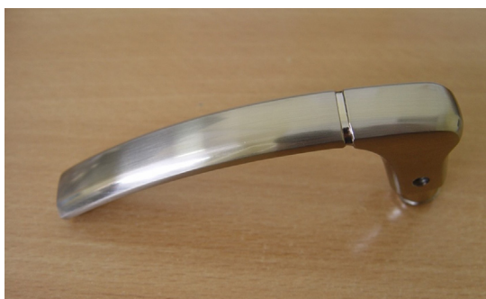
Príklad použitia kovového materiálu pri zapísanom dizajne Spoločenstva č. 2208066-0001

Štruktúra a materiál ako znaky vyjadrujúce dizajn sa teda zohľadňujú na účely dizajnového práva iba vtedy, keď ich je možné vnímať zrakom. Napríklad, rozdiel medzi lesklým a matným spracovaním povrchovej úpravy výrobku je vnímateľný zrakom. Tiež je možné zrakovo, vnímať odlišnosti vo vzhľade výrobkov vyrobených zo skla, plastu, hliníka alebo dreva. Úrad tak napríklad poznamenal v tejto súvislosti, že „[v]ýrobok so zhodným priestorovým prevedením sa [...] vzhľadom môže líšiť v prípade, ak je vyrobený z rôzneho materiálu, ako sa napríklad drevená hračka odlišuje od hračky z priehľadného plastu.“ 51