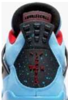
Jordan Brand "Cactus Jack" Apparel (2019)