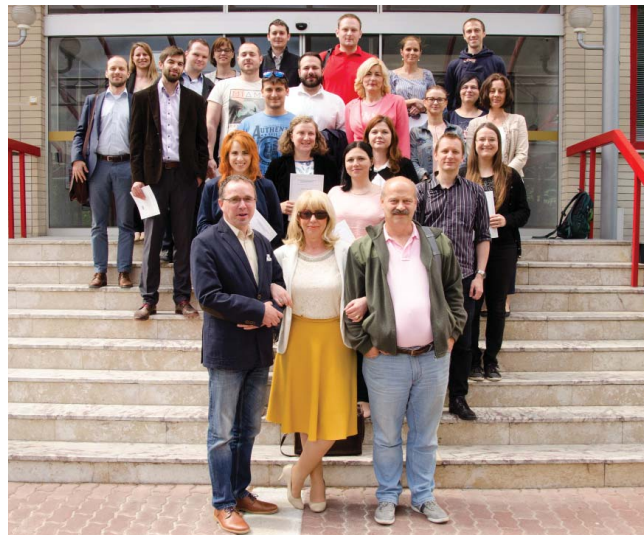
Modul C úspešne ukončilo 24 účastníkov.